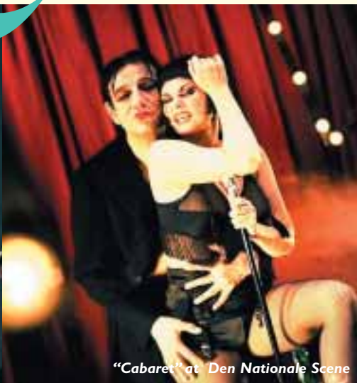
"Cabaret" at Den Nationale Scene