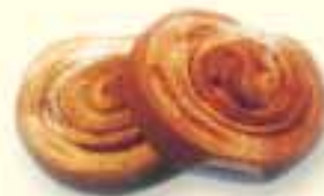
dolci alla cannella

La gente, qui, ha sempre l'aria di correre da una festa all'altra