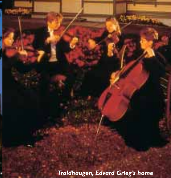
Troldhaugen, Edvard Grieg's home

norvegese, e il conosciutissimo Edvard Grieg. Henrik Isben non è nato qui, ma qui ha trovato il suo primo incontro con il mondo del teatro nonché ispirazione per i suoi drammi. Anche Edvard Munch non è di Bergen ma, grazie a mecenati locali, la città possiede una collezione unica dei quadri del maestro.