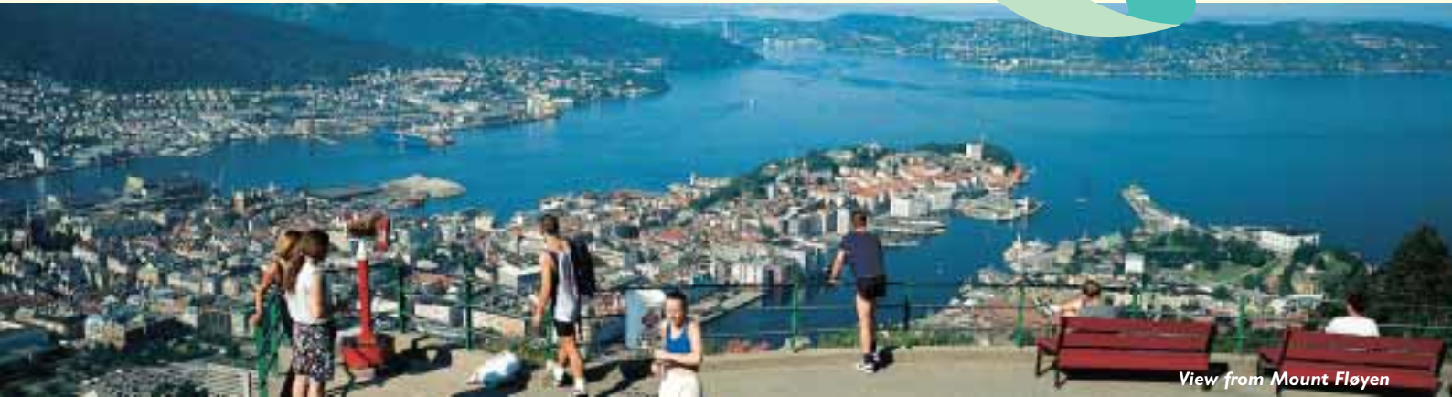
View from Mount Fløyen