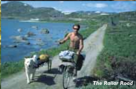
The Rallar Road