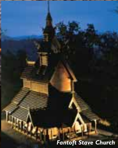
Fantoft Stave Church