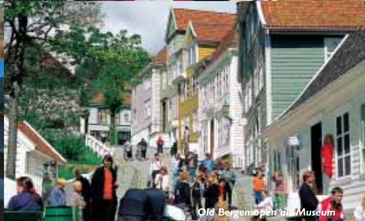
Old Bergen open air Museum

Venite in estate, quando la terra luccica di ogni sfumatura di verde, quando i fiordi sono pieni di barche e battelli, e la città risuona dei suoi visitatori.