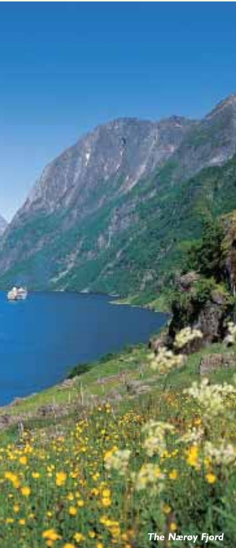
The Nærøy Fjord