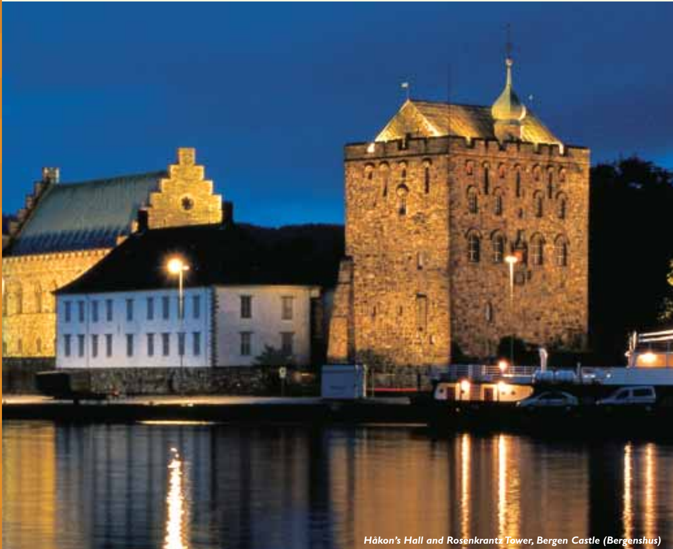
Håkon's Hall and Rosenkrantz Tower, Bergen Castle (Bergenshus)