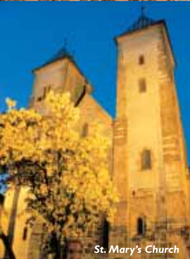
St. Mary's Church