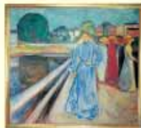
Edvard Munch: Il Molo 1903, Bergen Billedgalleri

La ricchezza del commercio porta alla cultura