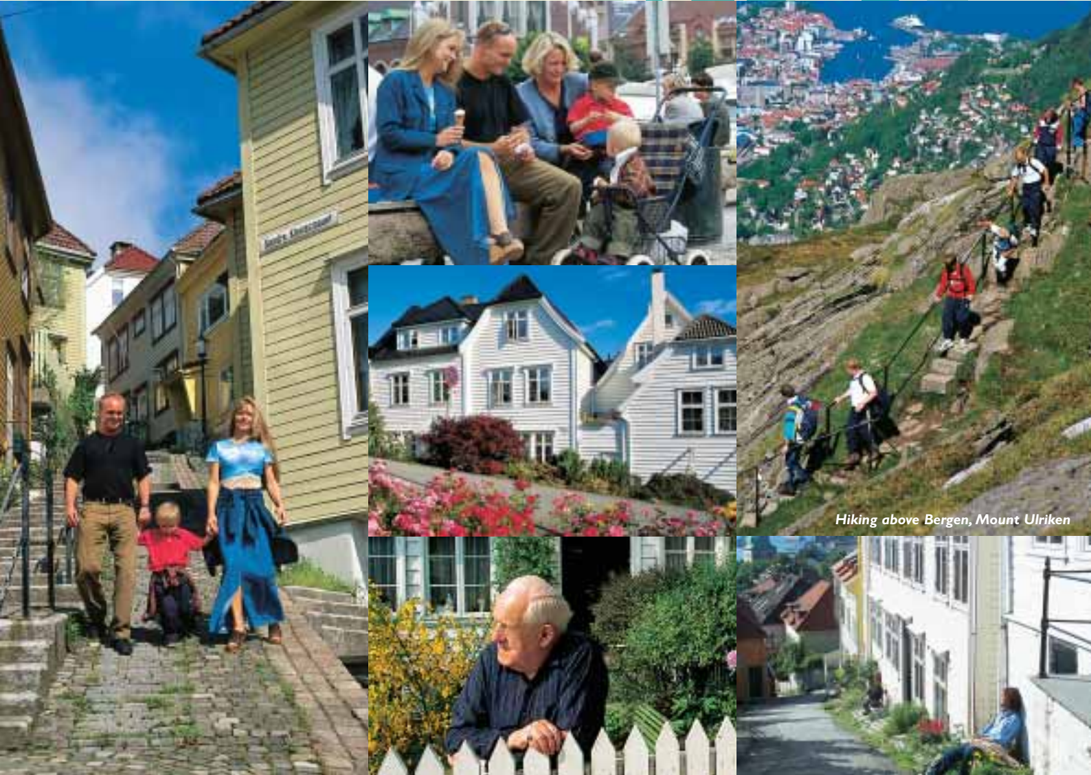
Hiking above Bergen, Mount Ulriken

Le case in legno sono come delle isole di passato inserite in un contesto moderno e sono le testimoni dell'intento di conservare la particolare architettura tradizionale locale. Per questo, nonostante i numerosi incendi che ci sono stati nei secoli, Bergen è una delle città in legno più grandi d'Europa, forse la più grande.