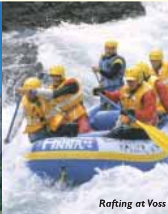
Rafting at Voss