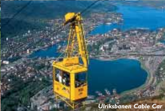
Ulriksbanen Cable Car