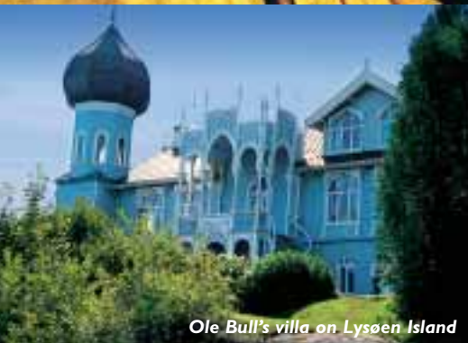
Ole Bull's villa on Lysøen Island