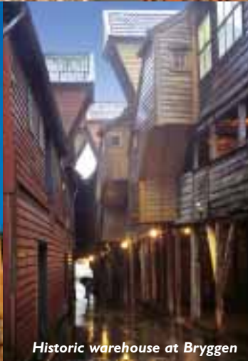
Historic warehouse at Bryggen