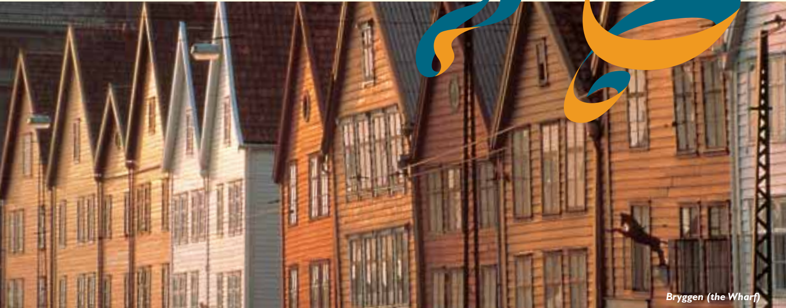
Bryggen (the Wharf)